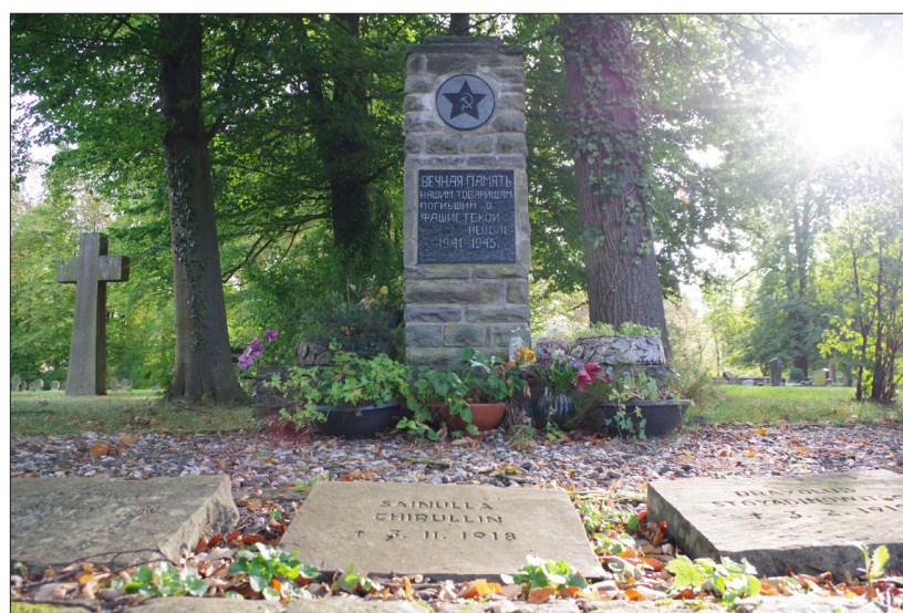
Denkmal auf dem Münstereifeler Friedhof

eingeladen. Nach eröffnenden Worten der Bürgermeisterin