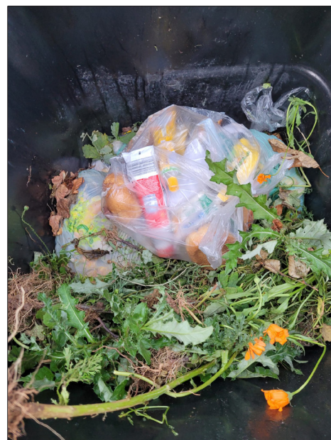
Blick in die Tonne

Bioabfälle sollten im besten Fall lose in einem dafür vorgesehenen Behälter gesammelt und direkt – ohne Plastiktüte bzw. kompostierbare Plastiktüte – in die Biotonne entleert werden. „Wer seinen Bioabfall dennoch in einer Plastiktüte sammeln möchte, kann den Inhalt in der Biotonne entleeren und die Plastiktüte im Anschluss in den Restmüll geben. In den meisten Fällen steht die Restmülltonne direkt neben der Biotonne“, appelliert Karen Beuke. Deutlich einfacher sei es, Zeitungspapier oder Papiertüten zu verwenden.