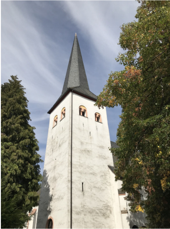
Westturm und Taufbecken der Kirche stammen aus dem 12. Jahrhundert.